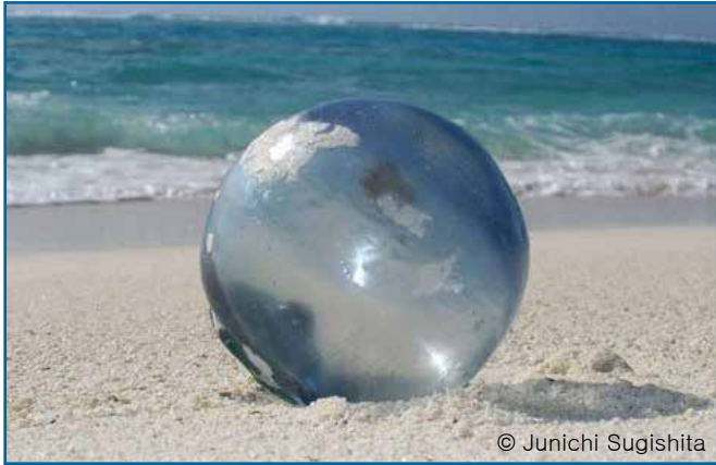
45. 부이 (유리)