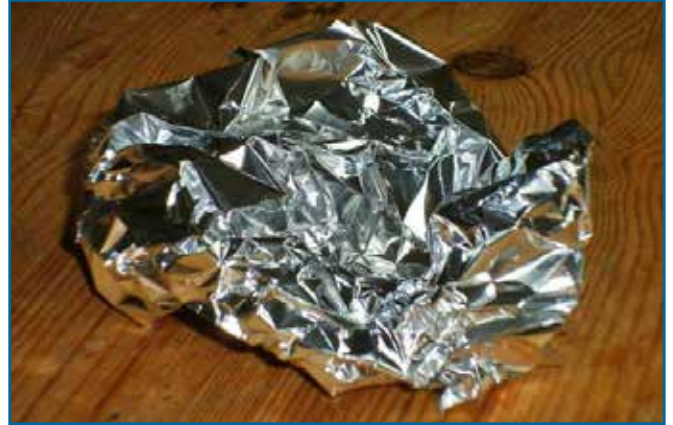
71. 포장지 (호일 / 금속)