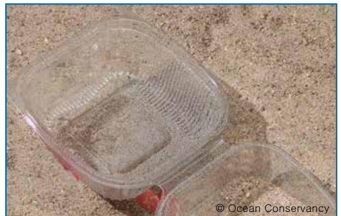
18. 컨테이너: 인스턴트 음식, 도시락 등