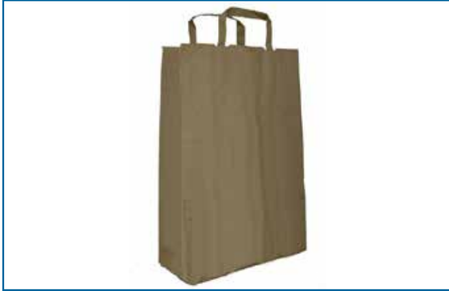
90. 가방 (종이)

여기에 아이템이 나열되어 있지 않으면 기타 아이템들 로 분류하여 기록해 주십시오.