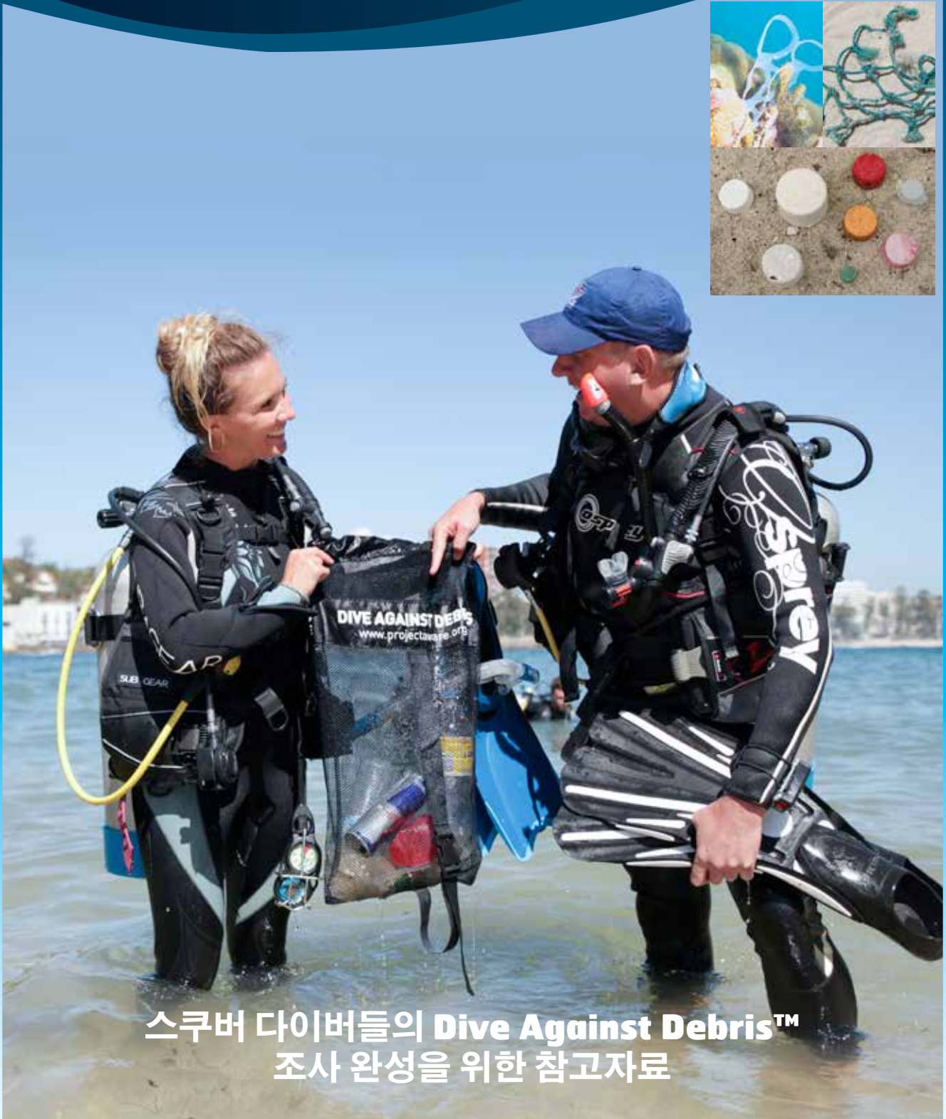
스쿠버 дай버들의 Dive Against Debris™ 조사 완성을 위한 참고자료