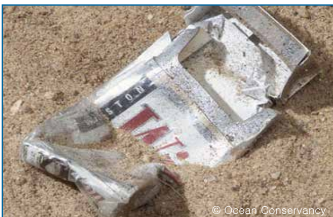
41. 담배갑 & 포장지