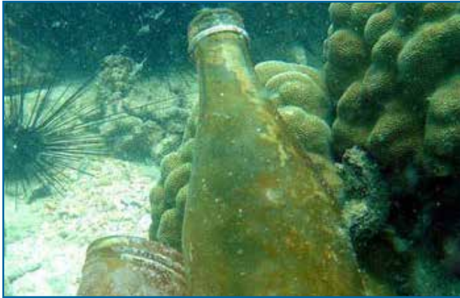
44. 음료수병 (유리)

여기에 아이템이 나열되어 있지 않으면 기타 아이템들 로 분류하여 기록해 주십시오.