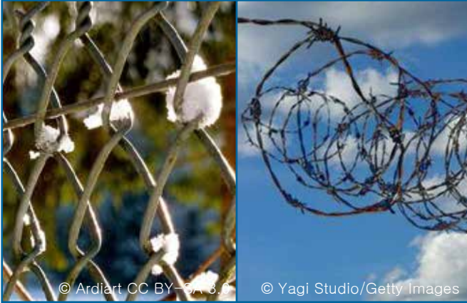
70. 철사, 철망, 철조망