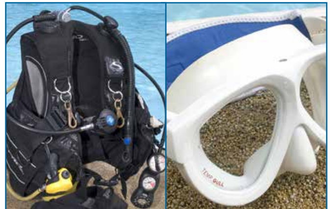
34. 스쿠버 & 스노클 장비, 마스크, 스노클, 핀