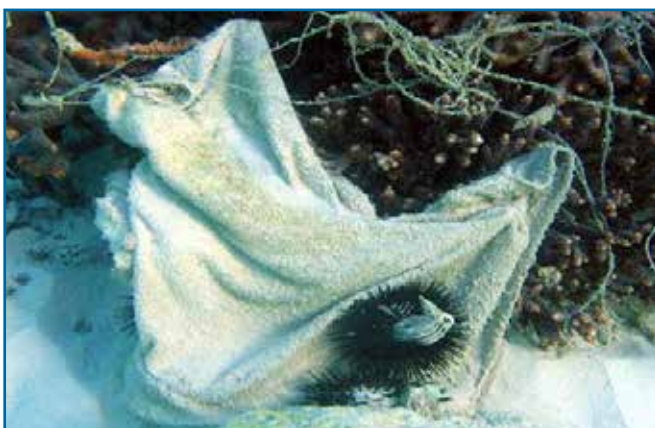
88. 타올, 걸레