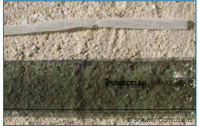
38. 빨대, 젓기용 막대