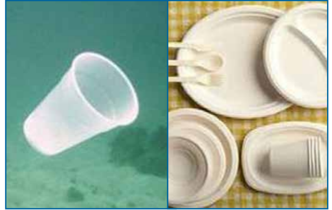
20. 컵, 접시, 포크, 나이프, 스푼 (플라스틱)