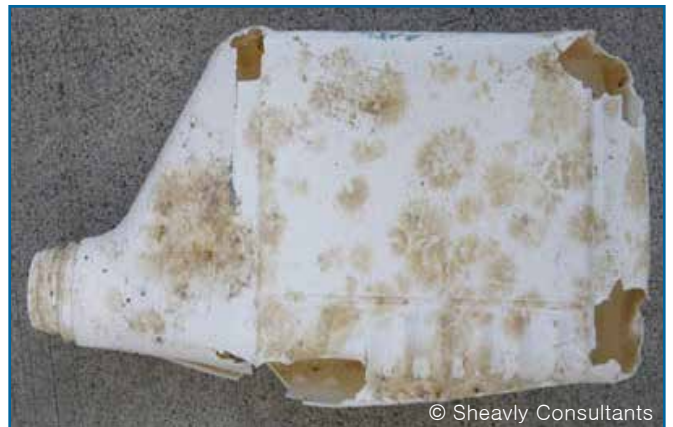
10. 병: 기름 / 윤활유