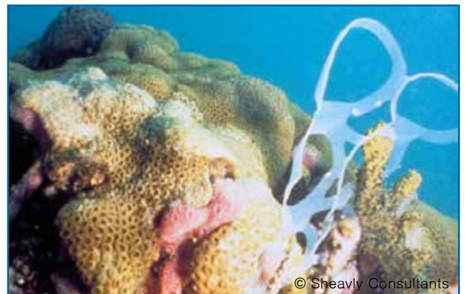
36. 식스팩링, 링 캐리어