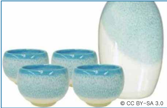
46. 컵, 쟁반, 식기, 접시 (유리 & 세라믹)