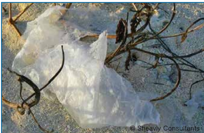
35. 랩핑: 방수지, 비닐 종이, 키친랩