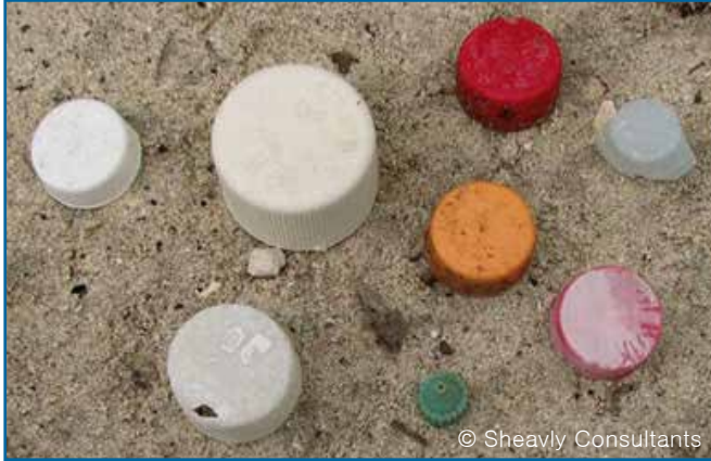
13. 뚜껑 & 마개 (플라스틱)

수중에서 다이버들이 발견한 쓰레기 아이템들만을 Dive Against Debris™를 통해 보고합니다