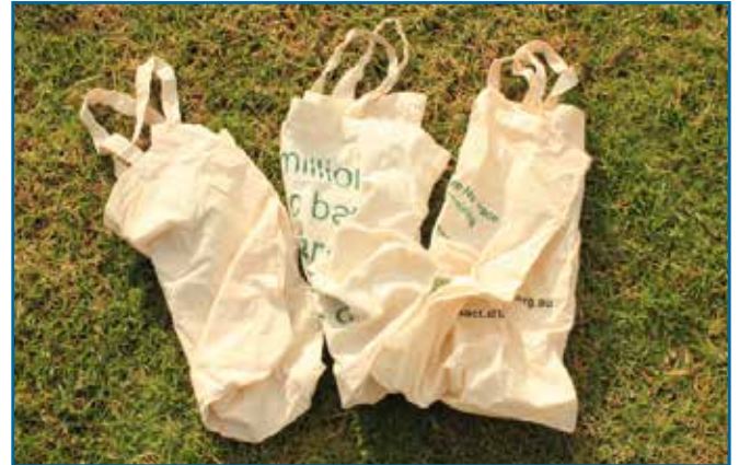
85. 가방 (천)