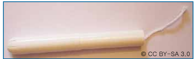
40. 탐폰 주입기