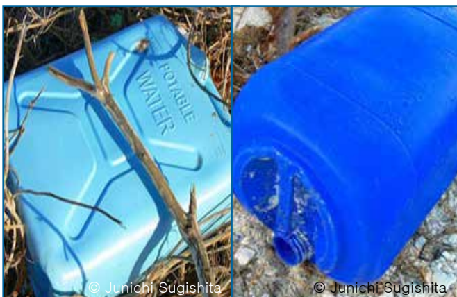
11. 양동이, 드럼통 & 통: 2 리터 이상