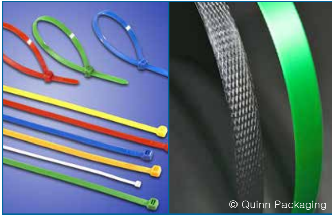
37. 케이블 타이, 노끈 (플라스틱)

참가자 숫자를 보고할 때 수중에서 쓰레기를 수거한 дай버들의 숫자만을 세어 합계에 기록합니다.