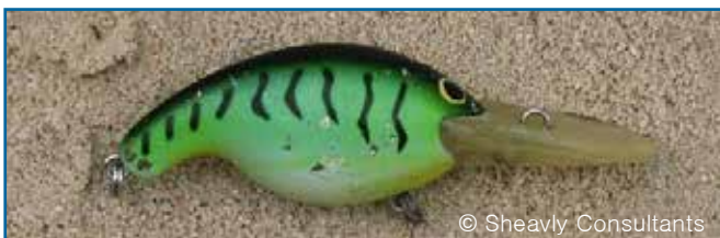
23. 낚시 미끼: 낚싯대