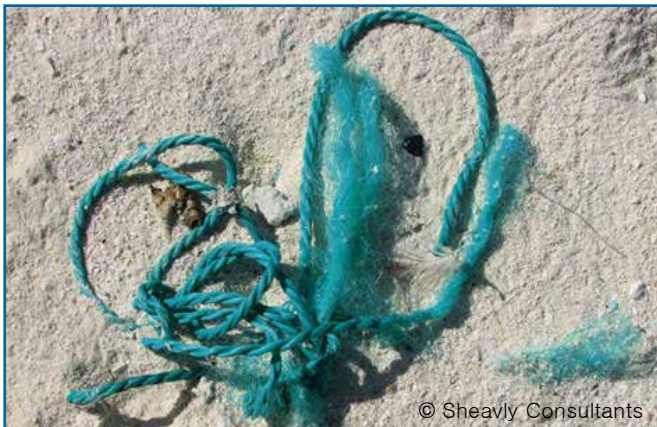
33. 끈 (플라스틱 / 나일론)