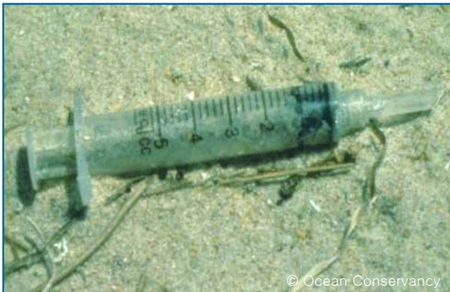
39. 주사기 (플라스틱)