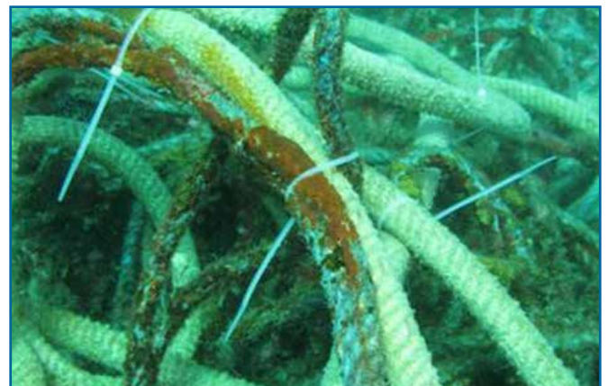
87. 밧줄 & 끈 (천) - 참고: 천연 재질로 된 밧줄은 섬유 모습을 띵니다.