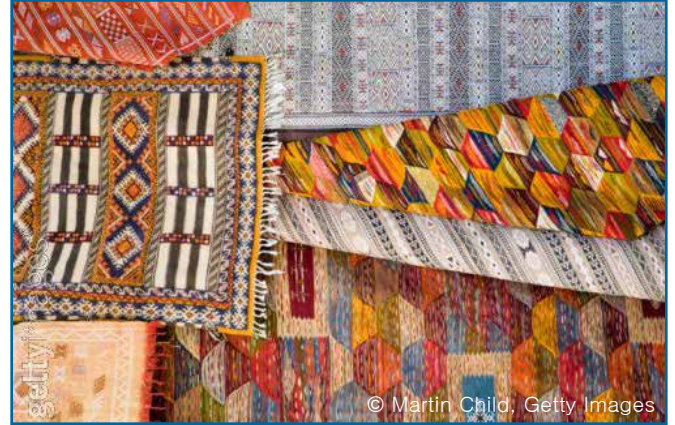
14. 카페트 (합성재질, 인조)