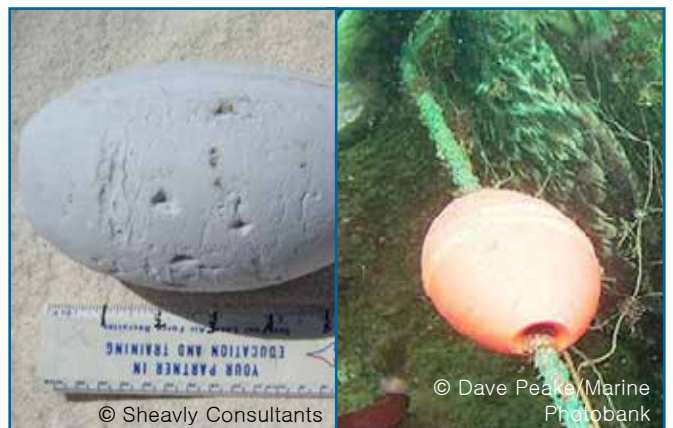
12. 부이 & 부표 (플라스틱 & 스티로폼)