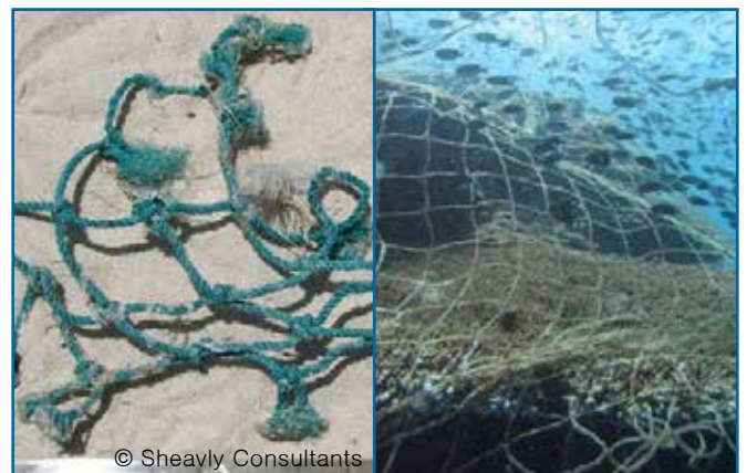
24. 낚시 그물 & 그물 조각