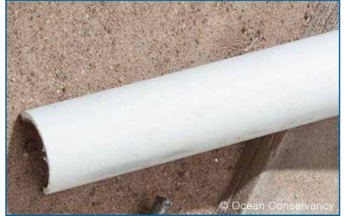
32. 파이프 (플라스틱 / PVC)