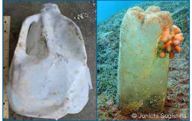
08. 음료수병: 2 리터 이상 (플라스틱)