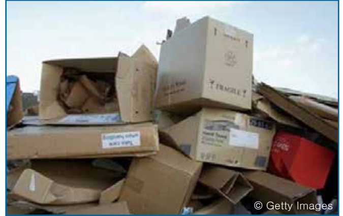
91. 골판지: 팩킹 & 종이 상자