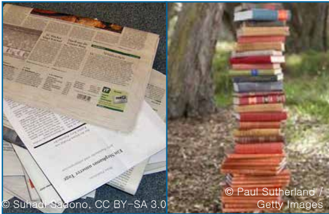
92. 종이: 책, 신문, 잡지 등