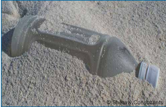
07. 음료수병: 2 리터 미만 (플라스틱)