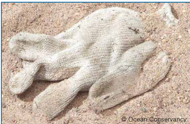
86. 장갑 (천)