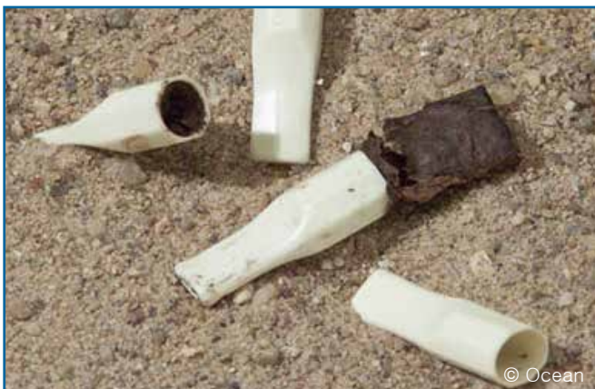
17. 시거 팁