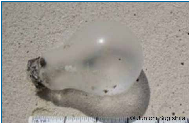
49. 백열등, 전구 등