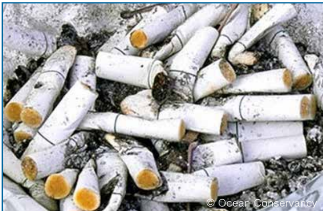
15. 담배 공초