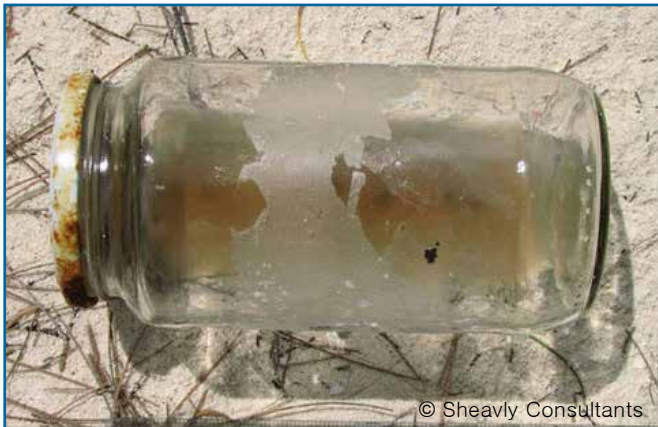
48. 음식 용기 (유리)