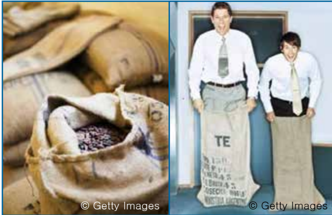
84. 가방 (마대 자루 / 자루)

여기에 아이템이 나열되어 있지 않으면 기타 아이템 들로 분류 하여 기록해 주십시오.