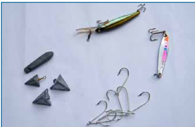
62. 낚시 용품: 봉돌, 미끼, 낚시바늘