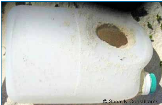
09. 병: 표백제, 세정제